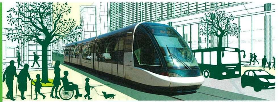
LRTの車両はイメージです(写真はストラスブル(仏)の車両)

宇都宮市は、公共交通にLRTが加わることで、バスなどの他の交通手段も便利になり、もっと活力のあるまちへと変わります。今回は、乗り換え施設(トランジットセンター)に関するご質問にお答えします。