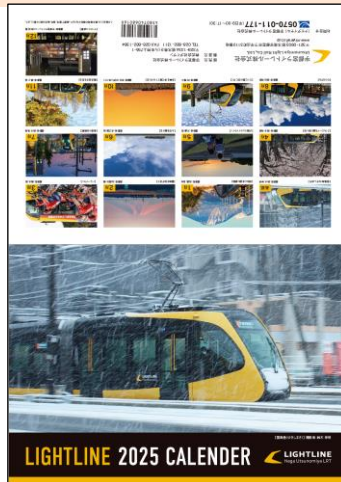
A4サイズ 税込価格：1,000円