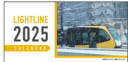
卓上サイズ 税込価格：800円

開業1周年を記念した『ライトライン2024フォトコンテスト』の入賞作品を使用したオリジナル公式カレンダーです。種類はA2サイズ、A4サイズ、卓上サイズの3種類です。昨年も大変好評だったため、取り扱い数量と展開サイズを増やしてご用意しました。11月中旬頃から順次発売開始予定です。(オープンスクエア(宇都宮駅西口)では、A4サイズのみ11/7～先行発売開始)