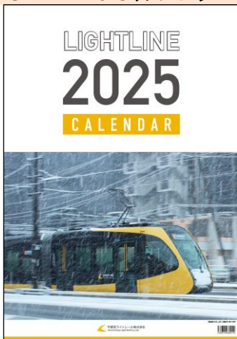
A2サイズ 税込価格：1,250円